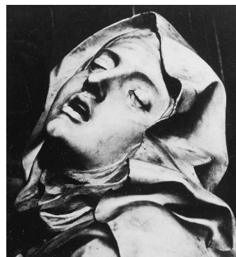
Bernini Szent Teréz látomása című szobrának részlete (Szent Teréz arca)