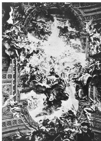
Gaulli: Jézus Szent nevének imádata.

A római II Gesù mennyezete (1670 és 1683 között)