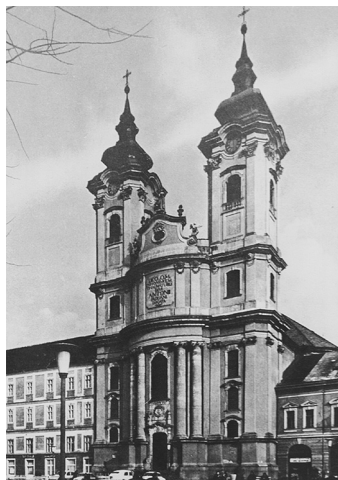
Az egri Minorita-templom (1758–1773)